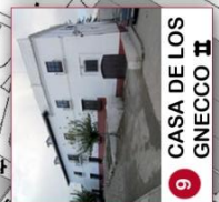
9 CASA DE LOS GNECCO II