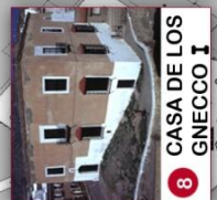
8 CASA DE LOS GNECCO I