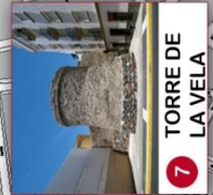
7 TORRE DE LA VELA