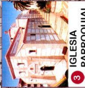
3 IGLESIA PARROQUIAL