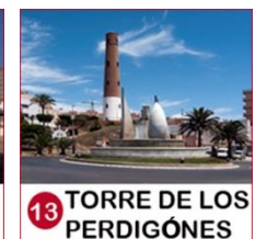
13 TORRE DE LOS PERDIGONES