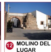
12 MOLINO DEL LUGAR