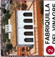
2 FABRIQUILLA DEL VINAGRE