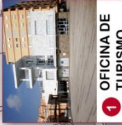
1 OFICINA DE TURISMO