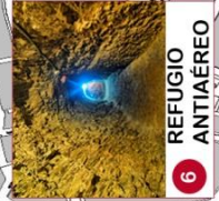
6 REFUGIO ANTIAEREO