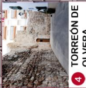
4 TORREÓN DE OLVERA