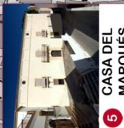
5 CASA DEL MARQUÉS