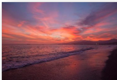
ENCUENTROS CON LA NATURALEZA. II.