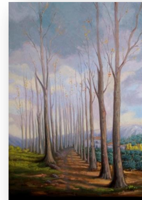
CAMINO ARROYO LA DEHESA.ÚBEDA