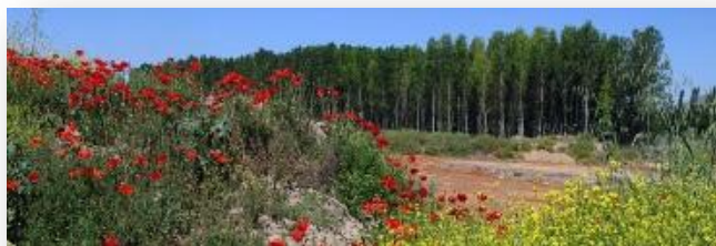
ENCUENTROS CON LA NATURALEZA. IV.