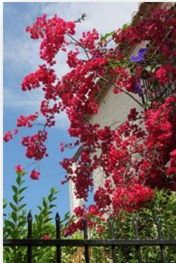
ENCUENTROS CON LA NATURALEZA. I.