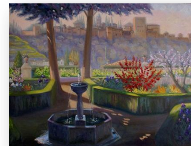
ALHAMBRA DESDE EL CARMEN DE LA VICTORIA